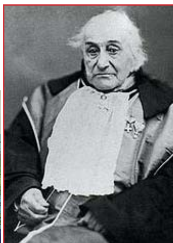
Antonio Bertoloni, botanico dell'Università di Bologna

Autorizzazione del Tribunale di Bologna n. 7715 del 29 Novembre 2006